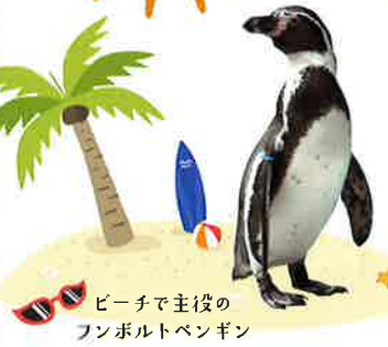
ビーチで主役のフンボルトペンギン